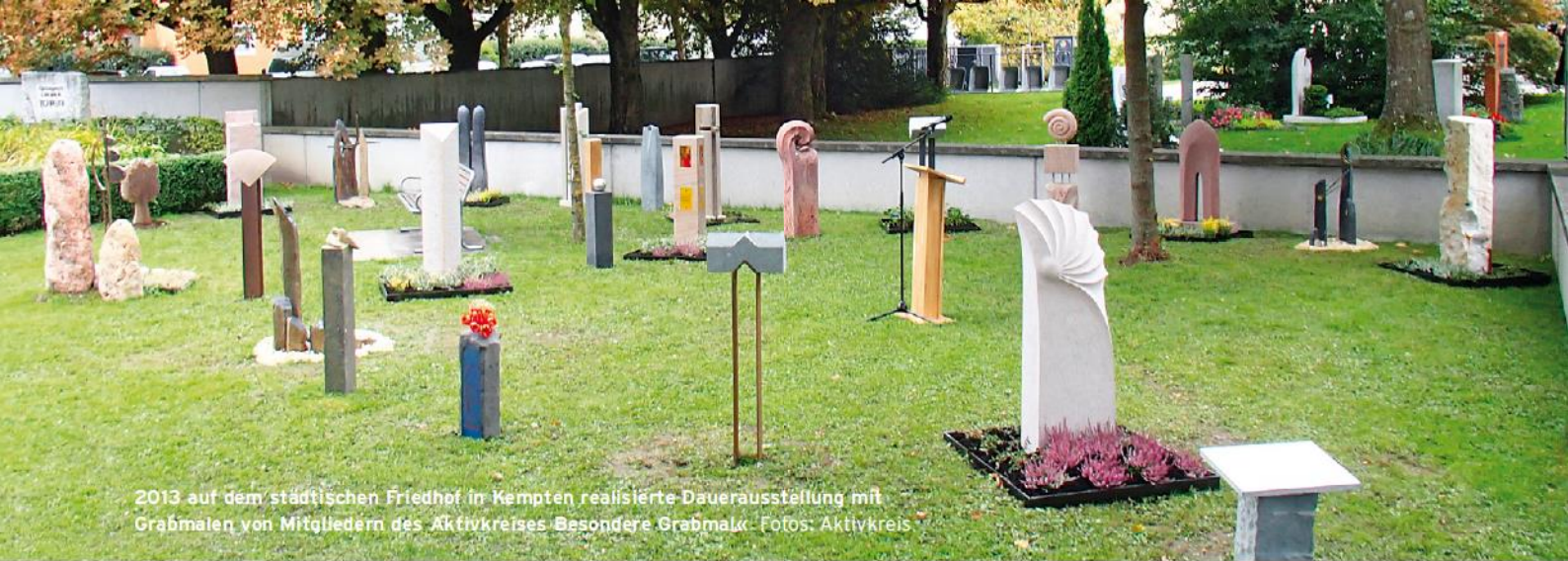
2013 auf dem städtischen Friedhof in Kempten realisierte Dauerausstellung mit Grabmalen von Mitgliedern des Aktivkreises Besondere Grabmale.